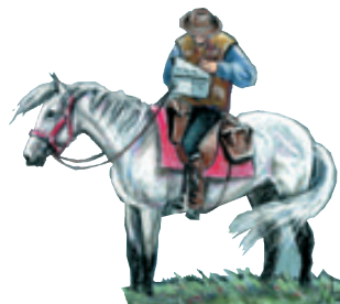
Dessinoriginal : Véronique De Saint Vaulry

Le soir, penchés sur votre carnet de route, les organisateurs calculeront vos pénalités : minutes d'avance ou de retard par rapport à l'allure imposée, contrôle raté, mauvais chemin... Chaque erreur entame le capital de 260 points que vous possédiez au départ.